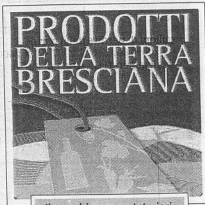
Il marchio presentato ieri